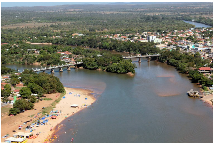
Pontes que separam os rios Garças e Araguaia, situadas na divisão de cidade-estado Barra do Garças, Pontal do Araguaia e Aragarças.

Proliferavam os garimpos. A região também foi ativada por extratores do látex da árvore do cerrado - a mangaba.